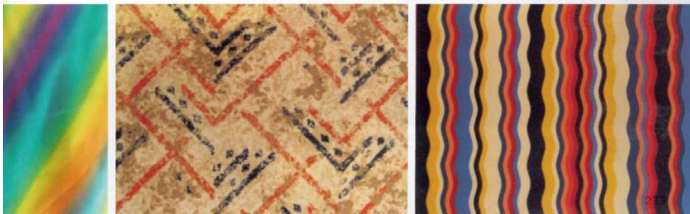
Da sinistra a destra, Colori Digitali , It's time for Africa e Ciclorama . Esempi dei tre mood Eurojersey per la p-e 2013.

Novità assoluta nel mondo di Jersey Lomellina è il tessuto Renew Plus con un nuovo filato di poliammide 100% riciclata: Econyl di Aquafil . Renew Plus , oltre ad essere rispettoso dell'ambiente, garantisce ottime prestazioni in termini di protezione dai raggi UV e del mantenimento della forma nel tempo, oltre ad essere soffice,