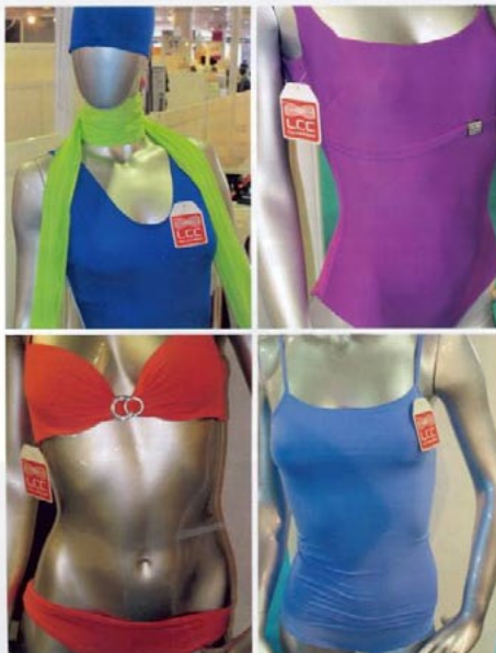
Dall'alto in senso orario, tessuti Acqua e Fuoco di Carvico e Aria e Terra di Jersey Lomellina. A destra, il filo Econyl di Aquafil è interamente realizzato con materiali di scarto, come ad esempio le reti da pesca in disuso.

Fra le novità presentate da Maglificio Moderno Zemme troviamo la linea Mineral Fit , tessuti dall'alto contenuto tecnologico. Il segreto si trova nel cuore stesso del tessuto, in particolare nella bioceramica contenuta all'interno della fibra e non unicamente in superficie. I tessuti, che incorporano questa fibra ( Emana , della Rhodia, per la poliammide e Bioceramic Resistex della Tecnofilati per il poliestere) hanno il vantaggio di riflettere totalmente i raggi solari, con effetti benefici sia come barriera per i dannosi raggi UV, che come freschezza garantita. Inoltre, i raggi ad alta frequenza prodotti dalla bioceramica, agiscono sulla pelle migliorando la circolazione e problemi come la cellulite nonché riducendo l'accumulo di acido lattico, che porta ad affaticamento muscolare. L'effetto è permanente in quanto la bioceramica, trovandosi all'interno della fibra e non in superficie, non si disperde con l'uso e i lavaggi.