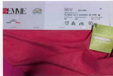
Tessuti della serie Mineral Fit di Maglificio Moderno Zemme .

compatto e leggero, anche grazie alla presenza di elastomero Xtra Life Lycra. Il nuovo tessuto ha superato i rigorosi test della piattaforma Lycra Beauty.