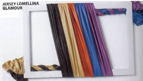
JERSEY LOMELLINA GLAMOUR

PER IL COSTUME DA BAGNO IL TREND VA VERSO TESSUTI SEMPRE PIÙ LEGGERI E SOTTILI MA AL CONTEMPO COMPATTI E COPRENTI, CON MODULI INTERESSANTI PER CONFERIRE AL CAPT BAGNO VESTIBILITÀ E SOSTEGNO. A MESE CHE NON SI TRATTA DI ARTICOLI MOLTO TECNICI, IN PARTICOLARE PER UN UTILIZZO BEACH SHAPING I PESI RARAMENTE SUPERANO I 200 GR/MQ ATTESANDO SI IN MEDIA SUI 150-170 GR/MQ