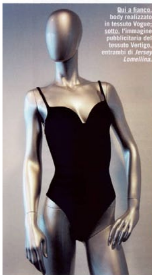
Qui a fianco, body realizzato in tessuto Vogue ; sotto, l'immagine pubblicitaria del tessuto Vertigo , entrambi di Jersey Lomellina .

CARVICO (di Carvico, BG) è una realtà contraddistinta da un percorso votato all'innovazione, alla ricerca e alla salvaguardia dell'ambiente. Il progetto LCC - Life Cycle Control coinvolge tre grandi realtà made in Italy: Carvico, Jersey Lomellina e Aquafil, e promuove i processi innovativi e l'utilizzo di materie prime di riciclo. A Mare di Moda debuttano due tessuti di Carvico realizzati con una base di poliammide riciclata in versione cava, che prevede un minor quantitativo di materia prima rispetto a un filo pieno: leggeri, non trasparenti, hanno un'elevata capacità di protezione UV e ottimi valori di coibenza termica. Le novità Carvico per il 2013: Capri , tessuto tecnico di mano morbida, ideale per costumi modellanti che valorizzano al meglio la silhouette con comfort, certificato Lycra beauty for swimwear; Revolutional Grace , il tessuto morbido e confortevole dalle grandi performance tecniche tipiche della famiglia Revolutional .